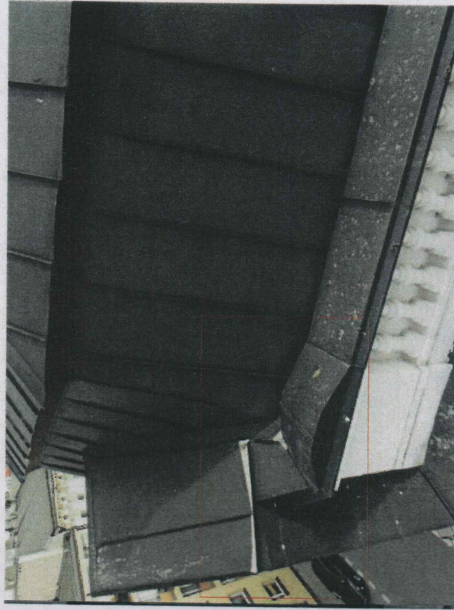
nieszczelności obróbek blacharski - należy uszczelnić (zastosować specjalistyczny uszczelniaacz dekarcki) w razie stwierdzenia podczas robót znacznej korozji - obróbki wymienić