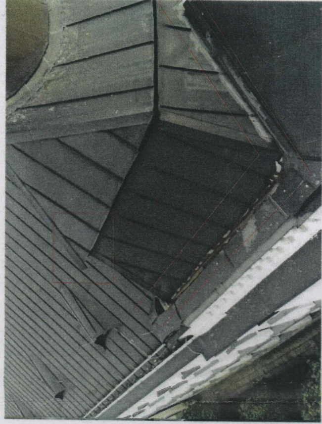
nieszczelności kosza odwadniającego - należy wymienić obróbkę blacharską kosza i część pokrycia dachu niewłaściwie zamontowana obróbka kalenicy skośnej - wykonać obróbkę na nowo