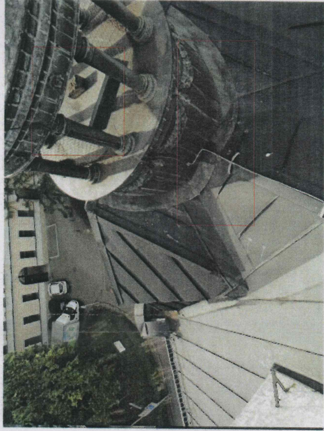
nieszczelności kosza odwadniającego - należy wymienić obróbkę blacharską kosza i część pionowego pokrycia dachu niewłaściwie dopasowane obróbki miedzianej wieżyczki do pokrycia z blachy - odpowiednio dopasować i uszczelnić (ewentualnie obróbki wymienić) niewłaściwie zamocowany wyłaz dachowy - wykonać prawidłowy montaż i zamykanie wyłazu