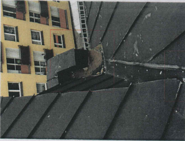
nieszczelności kosza odwadniającego - należy wymienić obróbkę blacharską kosza i część pionowego pokrycia dachu