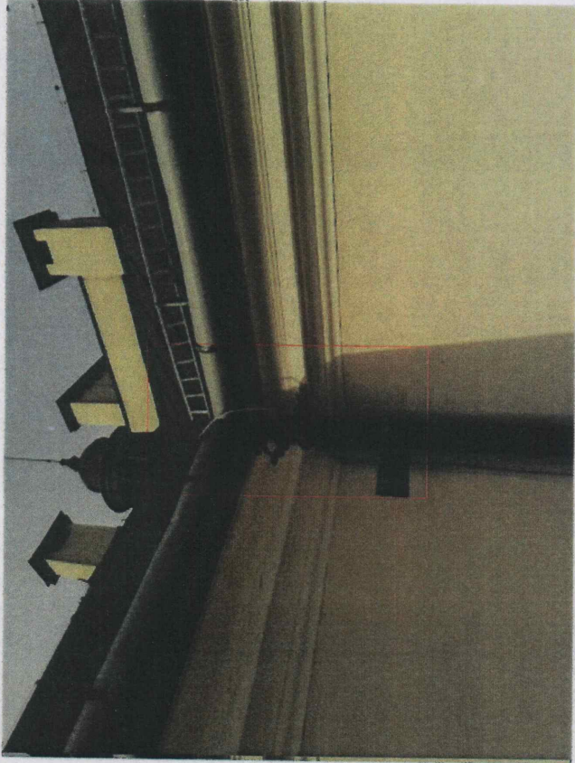
uszkodzenie gzymsu dachowego i nieuszczelność wpustu rynnowego - należy wymienić wpust wynnowy, uszczelnić połączenie wpustu z rurą spustową oraz naprawić fragment gzymsu wraz z tynkiem i powłoką malarską