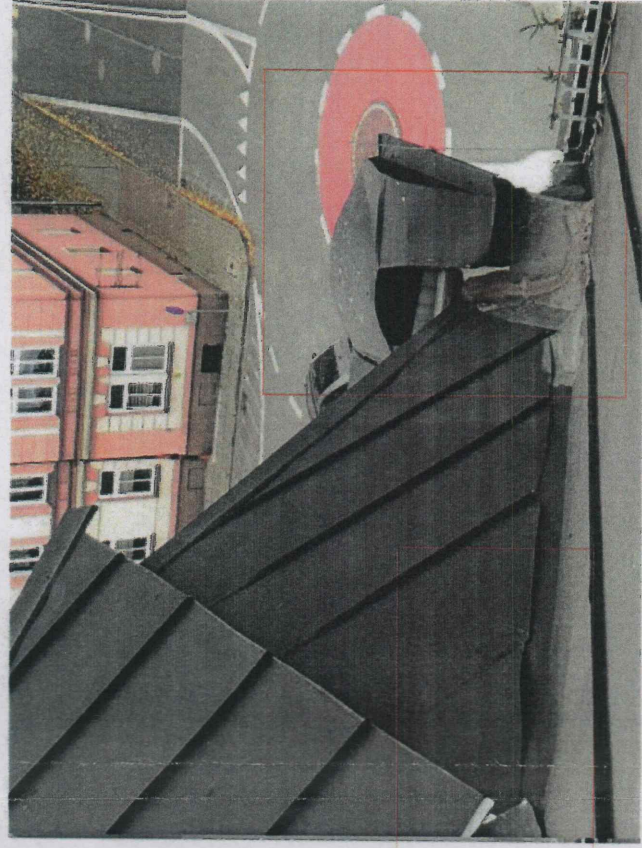
nieszczelności kosza odwadniającego - należy wymienić obróbkę blacharską kosza i część pokrycia dachu nieszczelność na połączeniu połaci dachowej (pionowej ze skośną) - wykonać obróbkę blacharską i uszczelnić