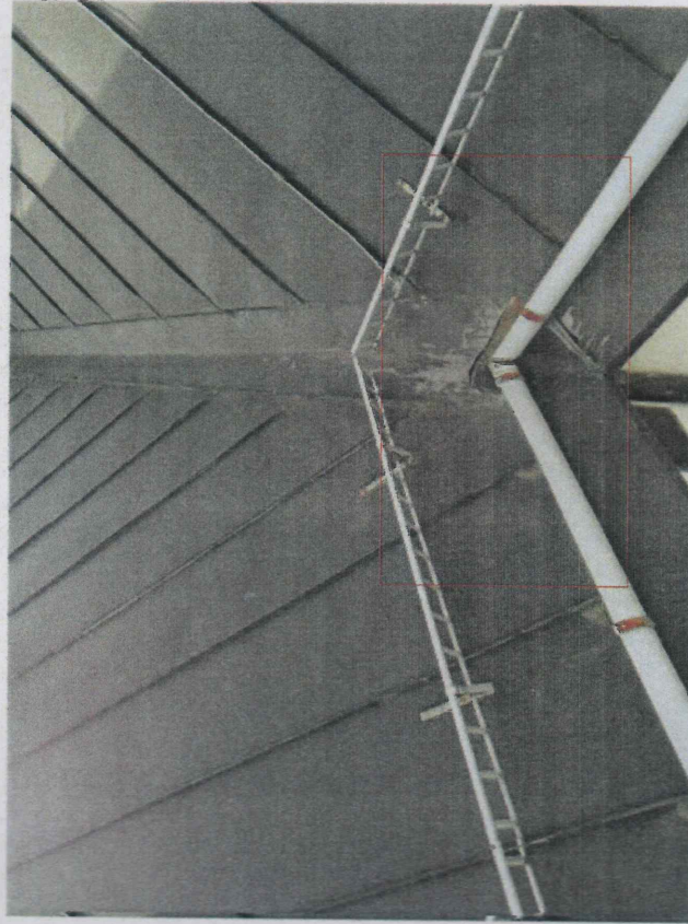
nieszczelność wpustu rynnowego - należy wymienić wpust wynnowy, uszczelnić połączenie wpustu z rurą spustową korozją wewnętrzną rynien dachowych - oczyścić i wykonać powłokowe zabezpieczenie antykorozyjne