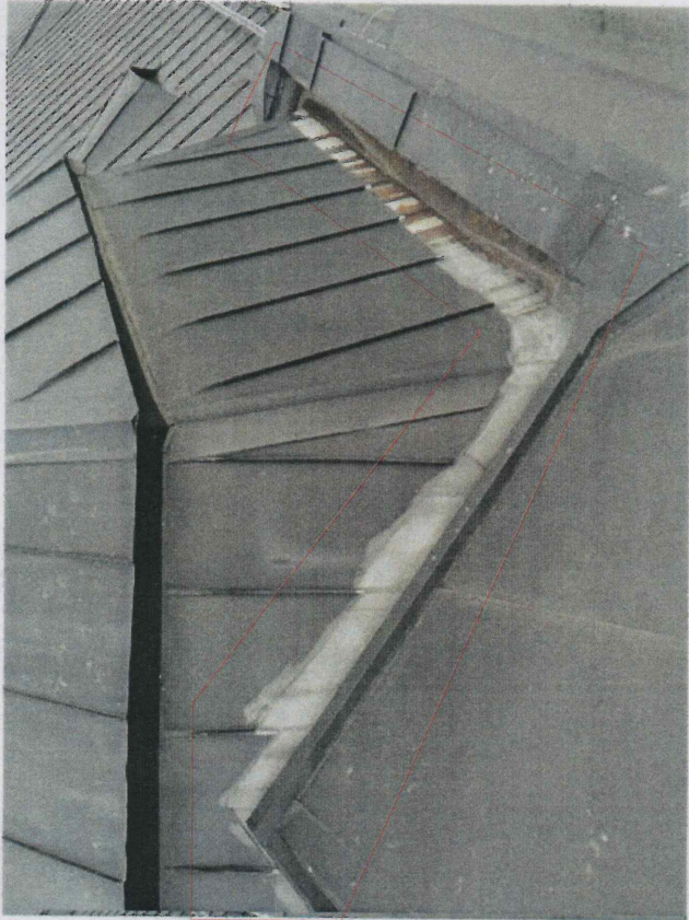
nieszczelności kosza odwadniającego - należy wymienić obróbkę blacharską kosza i część pionowego pokrycia dachu