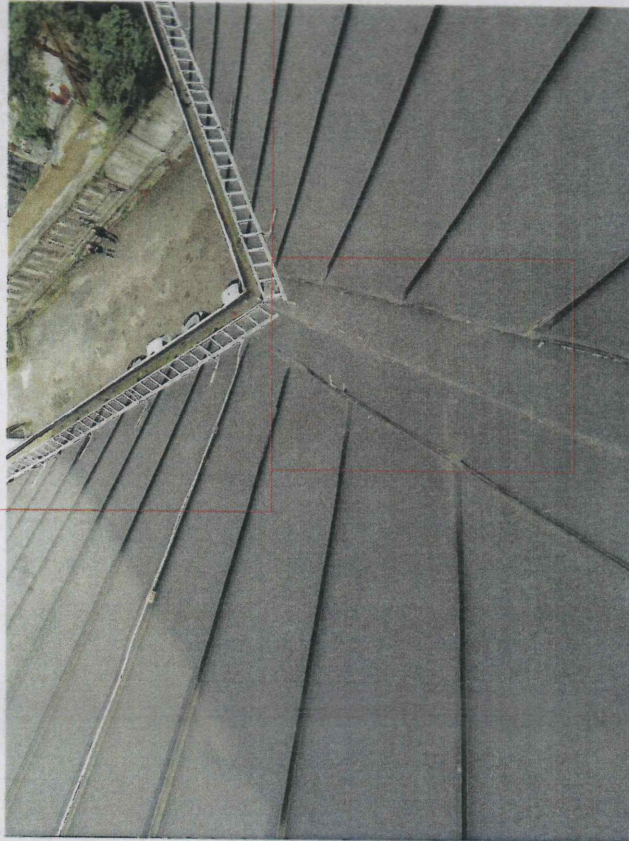
nieszczelności kosza odachowego - należy uszczelnić (zastosować specjalistyczny uszczelniaacz dekarcki) korozją wewnętrzną rynien dachowych - oczyścić i wykonać powłokowe zabezpieczenie antykorozyjne środkiem pitumicznym