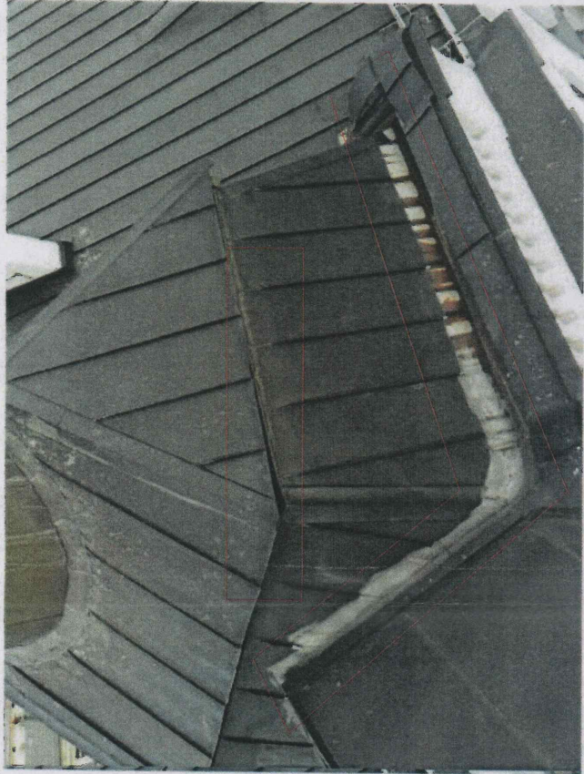
nieszczelności kosza odwadniającego - należy wymienić obróbkę blacharską kosza i część pionowego pokrycia dachu nieszczelność połączenia połaci dachowych - wykonać nową obróbkę blacharską