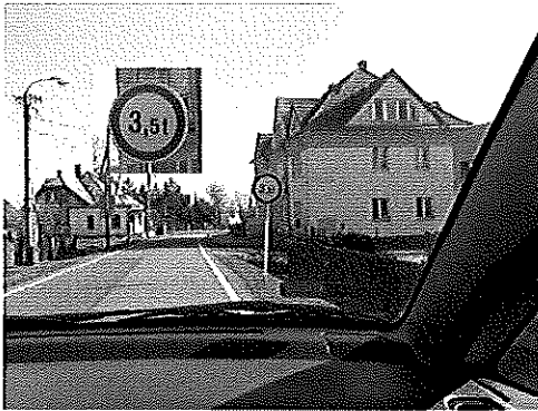
zdjęcie nr 1

W imieniu Zarządu Powiatu Cieszyńskiego informuję, że obecnie funkcjonujące oznakowanie zostało wprowadzone na podstawie zatwierdzonego projektu organizacji ruchu, zatwierdzenie nr WKT.5420-6/08 z dnia 12.02.2008 r. Wniosek o zatwierdzenie projektu organizacji ruchu został złożony przez Powiatowy Zarząd Dróg Publicznych w Cieszynie w związku z wejściem Polski do grupy państw Układu Schengen i dostosowaniu oznakowania pionowego do przekraczania granicy państwa bez kontroli. W chwili obecnej zgodnie z projektem organizacji ruchu, tonaż samochodów poruszających się po drodze powiatowej 2624S jest ograniczony do 3,5 t za pomocą znaków B-18 (zakaz wjazdu pojazdów o rzeczywistej masie całkowitej ponad 3,5t). Znaki B-18 znajdują się po obu stronach byłego przejścia granicznego w Kaczycach Górnych, zdjęcie nr 1 widok po stronie Republiki Czeskiej, zdjęcie nr 2 widok po stronie Polski.